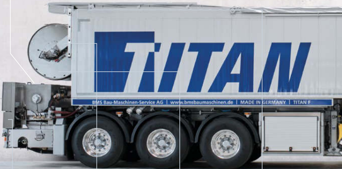
SCHALTSCHRANK MIT BEDIENERPULT