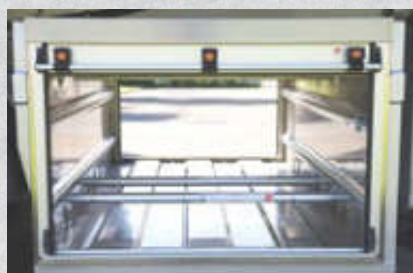
Rundsperrbalken für Staufach , praktische Ordnungshilfen und Ladungssicherung. 4 Stück serienmäßig. Titan Z Artikel-Nr. 13912