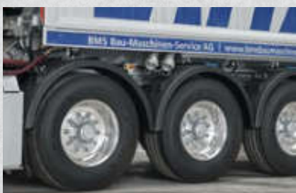
BPW ARC Nachlaufenkachse, hydraulisch gelenkt, max. Einschlagwinkel 12° Artikel-Nr. 15617