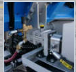
Im Leistungsumfang enthalten.