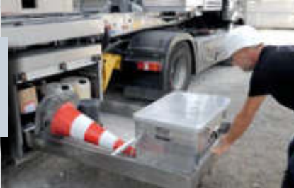
Edelstahl-Schublade , L 220 x B 100 x H 50 cm, Volumen 1,1m 3 , 2/3 beidseitig ausziehbar. Artikel-Nr. 15194