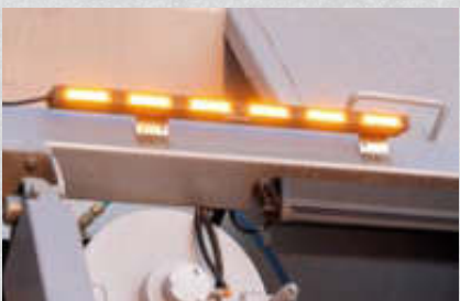
Heckwarnleuchte – im oberen Teil des Hecks verbaut. Artikel-Nr. 15513