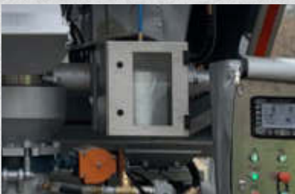
Häcksler , um Glaserfaser-Rohlinge zu schneiden. Schneidkopf 4.000 U/min. Artikel-Nr. 15511