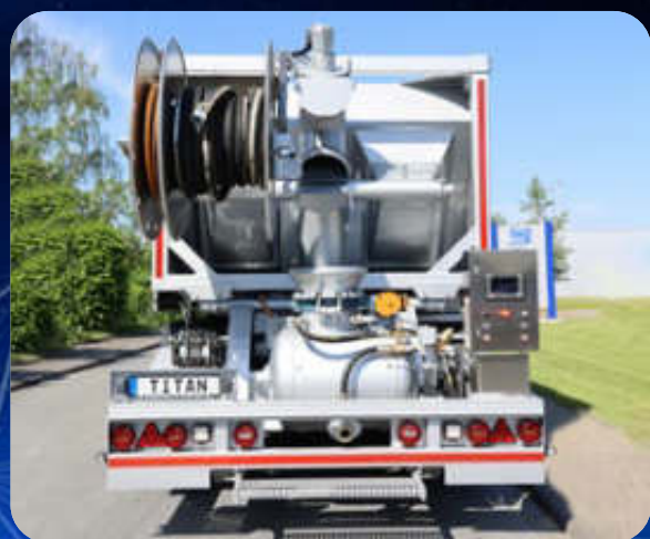
TITAN Z für Zementestrich