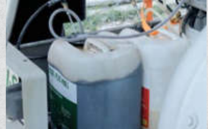
Aufschäumer , handliche Lanze aus Edelstahl, geeignet für bis zu 20 Liter Zusatzmittel, über Druckluft wird das Material aufgemischt. 1 Aufschäumer Artikel-Nr. 15417 2 Aufschäumer Artikel-Nr. 15512