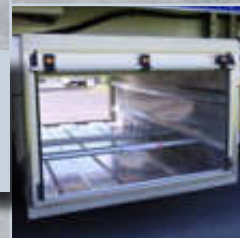
STAUFACH FÜR ZUBEHÖR