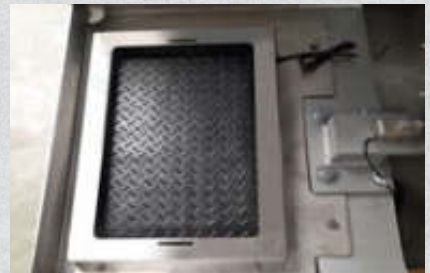
Heizmatte für Zusatzmittelbehälter , 110 W, Naturgummi, L60 x B40 x H1,5 cm für zwei 20 Liter Kanister. Artikel-Nr. 15514