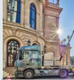
Vollautomatisch mischen Qualität.