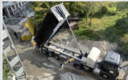
Die Baustelle kann Zeit und Material sparend abgearbeitet werden, sehr effektiv und kostengünstig.