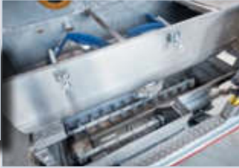
MISCHBEHÄLTER leicht zu reinigen.