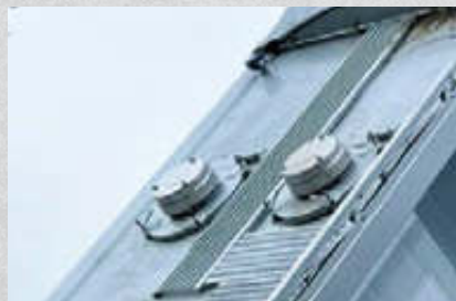
Bindemittelkammer , geteilt, Titan Z, individuell aufteilbar. Artikel-Nr. 15631