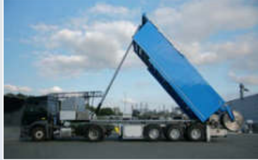
Kippendes System für Fließestrich. Der TITAN F. Kompakte Maschinenteknik, starke Leistung.