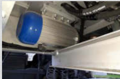
15 kVA Generator mit 12 kW Nutzleistung Artikel-Nr. 14139