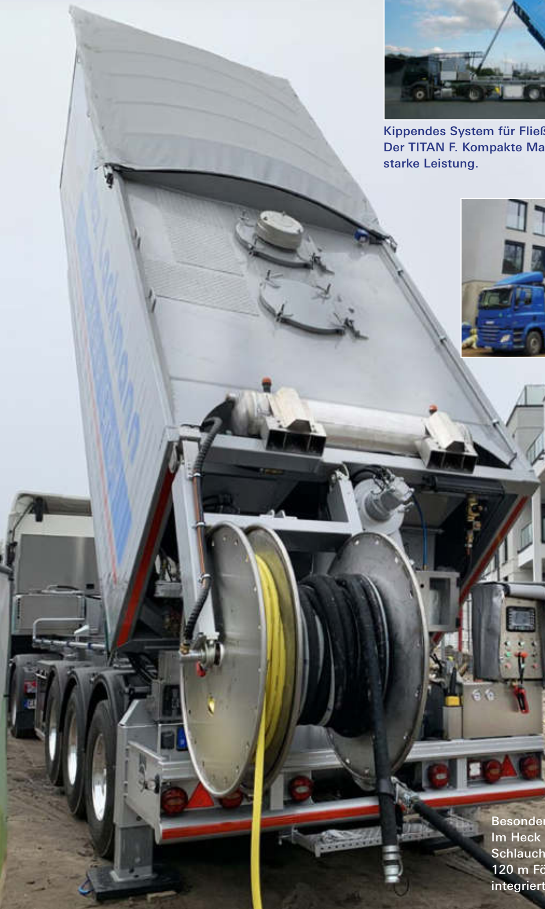
Besonders anwenderfreundlich: Im Heck positionierter Schlauchabroller für 120 m Förderschlauch mit integriertem Wasserschlauch.