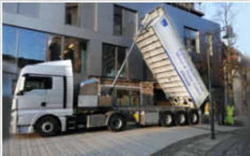
Arbeitseinsatz in der Fußgängerzone: Der TITAN ermöglicht schnelle Auf- und Abrüstzeiten. Die Baustelle bleibt sauber.