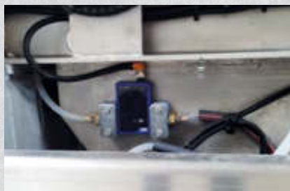
Durchflusssensor für Zusatzmittel, ermöglicht eine millilitergenaue Dosierung der Zusatzmittel. Artikel-Nr. 15627