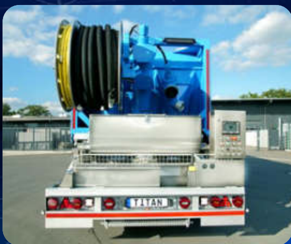
TITAN F für Fließestrich