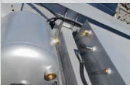
Druckluftbehälter 60 Liter Volumen, zusätzlicher Druckluftanschluss am Heck Artikel-Nr. 15319