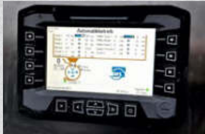
Wiegezellen für Z und F-Serie (serienmäßig)