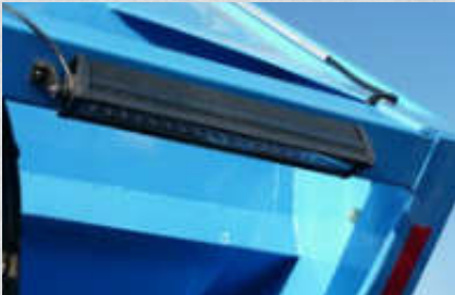
Großer LED-Arbeitsscheinwerfer für Z- und F-Serie (serienmäßig)