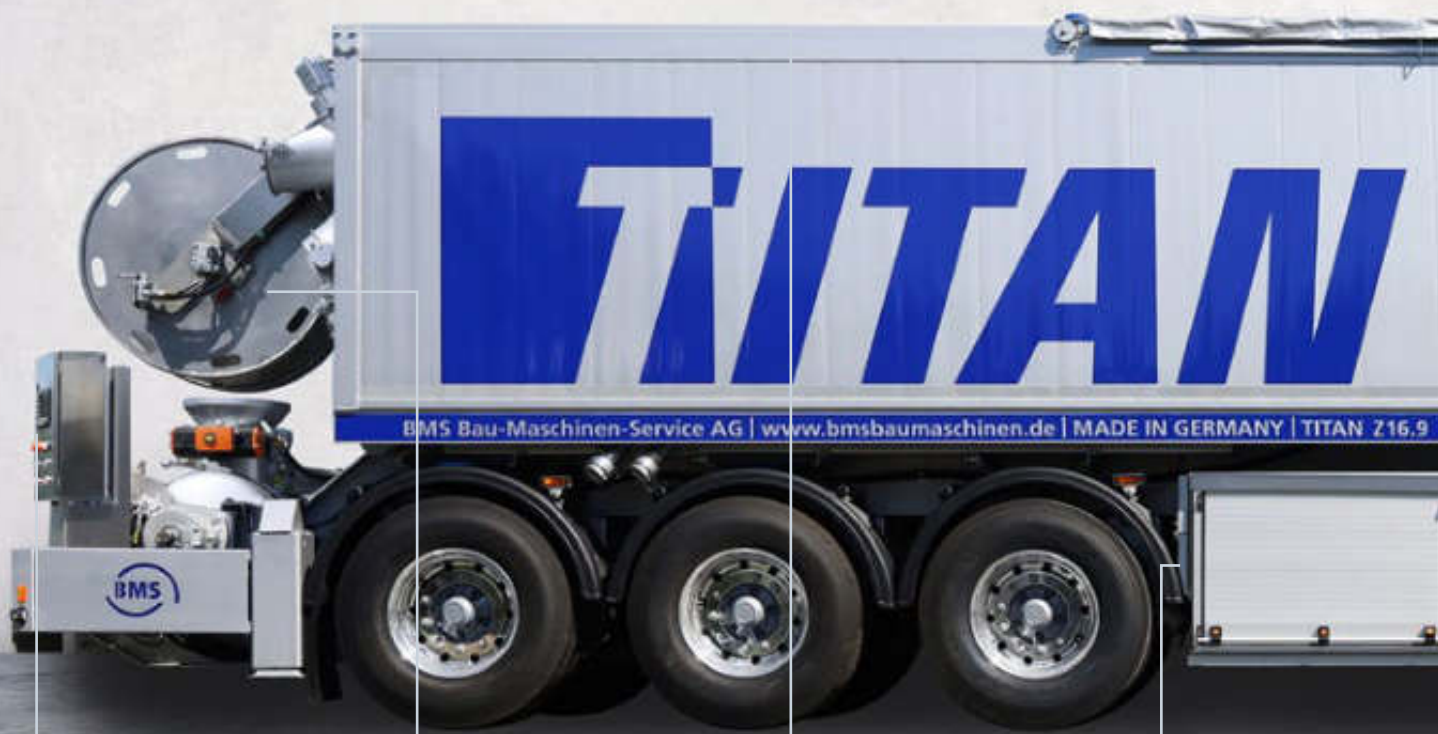
SCHALTSCHRANK MIT BEDIENERPULT