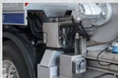
Zusatzmittelpumpe Titan Z, dosiert flüssige Zusatzmittel 1 Pumpe (serienmäßig) 2 Pumpen Artikel-Nr. 15406