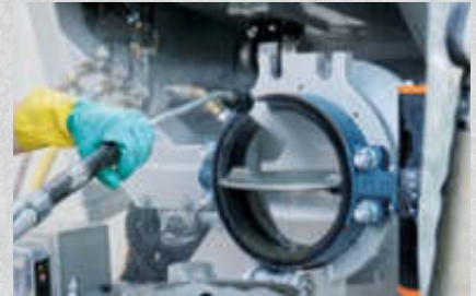
Hochdruckreiniger für Z- und F-Serie (serienmäßig)