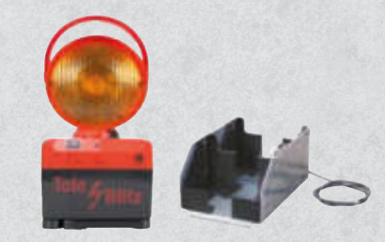
2 Blitzleuchten mit Ladeschale, Teleskopstange ausziehbar auf 1 m. Artikel-Nr. 15407