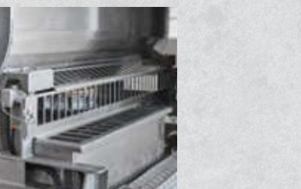
Zusatzmittelpumpe Titan F, dosiert flüssige Zusatzmittel 1 Pumpe Artikel-Nr. 15599 2 Pumpen Artikel-Nr. 15628