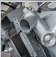
Wahlweise mit Förder- schnecke oder Förderband.