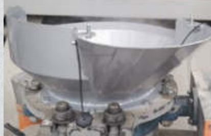
Trichter für Beuteleinwurf , Pulvermaterial kann mühelos zugeführt werden. Artikel-Nr. 14797