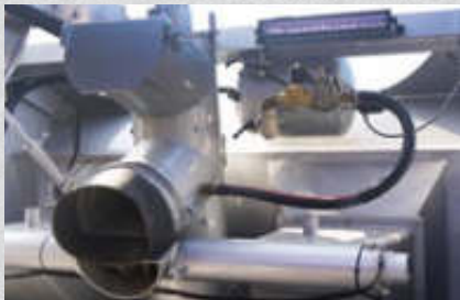
Wasserheizung, 2 kW-Heizspirale, im Wassertank verbaut, für Z-Serie (serienmäßig)