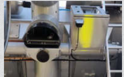
Rückfahrkamera, mit 120 Grad Sichtfeld, am Heck positioniert inkl. Bildschirm Artikel-Nr. 15405